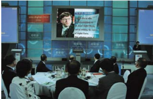
빌 게이츠 / 마이크로소프트 회장 (축하 메시지) Bill Gates / Chairman, Microsoft (Congratulatory Message)