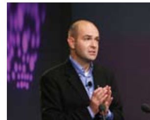
크리스 앤더슨 / 〈롱테일〉 저자, 〈와이어드〉 편집장 Chris Anderson / Author of The Long Tail Editor-in-Chief, Wired