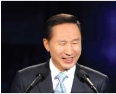
이 명 박 / 대한민국 대통령 Lee, Myung-bak / President, Republic of Korea