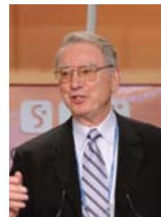
어윈 제이콥스 / 퀄컴 창립자 겸 회장 Irwin Jacobs / Co-founder & Chairman, Qualcomm