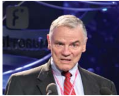
르로이 후드 / 시스템생물학연구소 설립자, 소장 Leroy Hood / President, Institute for Systems Biology