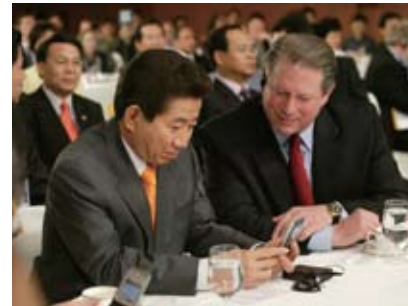
노무현 제16대 대통령과 앨 고어 前 미국 부통령 (2007 노벨 평화상 수상자) Roh, Moo Hyun / 16th President, Republic of Korea with Al Gore / Former U.S. Vice President, (2007 Nobel Peace Prize Laureate)