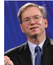
에릭 슈미트 / 구글 회장 Eric Schmidt / Chairman & CEO, Google