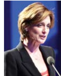
앤 스위니 / Disney-ABC 사장 Anne Sweeney / President, Disney-ABC TV Group