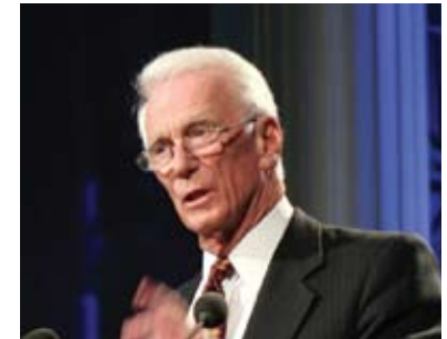
유진 서난 / 아폴로 17호 선장, 달을 밟은 마지막 우주인 Eugene Cernan / Commander of Apollo XVII, The Last Man on the Moon