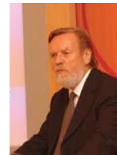
존 나이스빗 / 미래학자, <메가트렌드> 작가 John Naisbitt / Futurist, Author of Megatrends