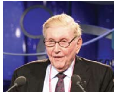
섬너 레드스톤 / CBS·바이어컴 회장 Sumner Redstone / Chairman, Viacom & CBS Corporation