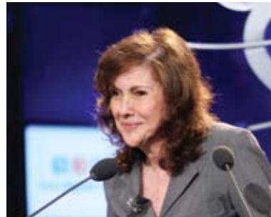
앤 드루얀 / 코스모스 스튜디오 대표 Ann Druyan / CEO, Cosmos Studios