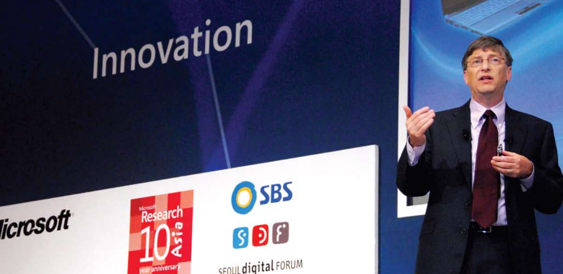
빌 게이츠 / 마이크로소프트 회장 Bill Gates / Chairman, Microsoft